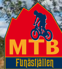
UTMED LJUSNANS STRAND